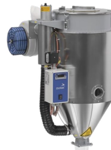
LUXOR HD 60

Os silos de secagem mais pequenas e leves, completamente isoladas foram concebidas para a montagem directa na máquina de processamento. Os silos construídos em aço inoxidável têm uma tampa oscilante com flange integrada para recepção de um alimentador para o enchimento automático com granulado de plástico. Para além disso têm uma grande porta de limpeza e uma janela de visualização.