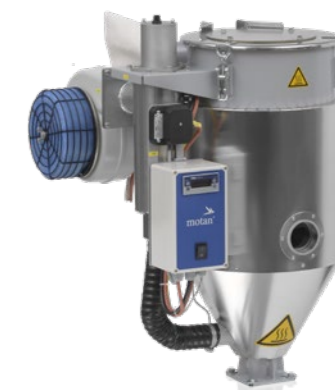
LUXOR HD 30

De série, os secadores de ar quente da série LUXOR HD estão equipados com uma válvula de correção. Para os secadores grandes LUXOR HD existem vários acessórios, como por ex. caixa de aspiração e válvula de correção para esvaziamento de material.