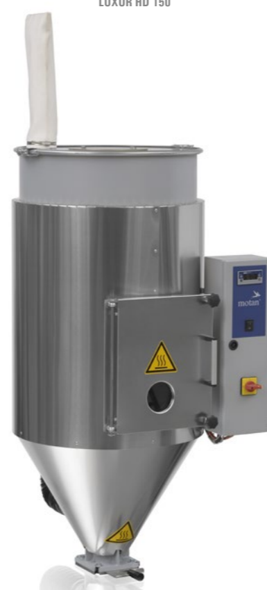
LUXOR HD 150

A indústria transformadora de plásticos necessita de equipamentos de alta performance que possibilitem uma alta qualidade de produto final. Os secadores a ar quente LUXOR HD são construídos com essas expectativas, com preços competitivos sem comprometer a sua performance. Estes secadores, tal como todo o equipamento motan são construídos conforme certificado CE.