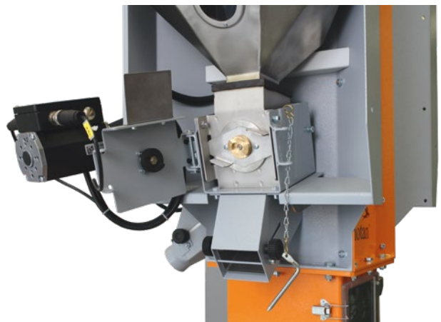
Fuso de dosagem montado com um suporte de um lado e com ligação rápida