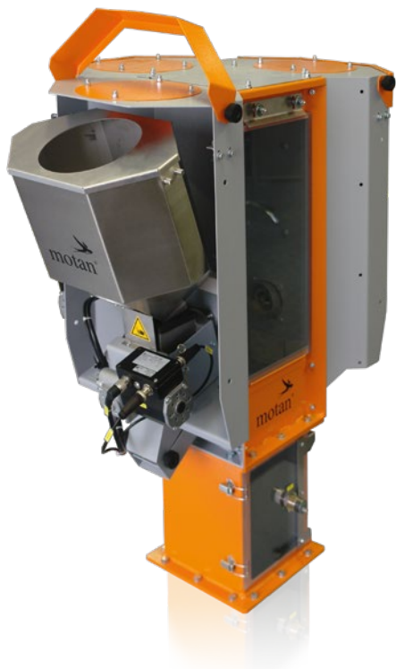
Sistema de substituição rápida