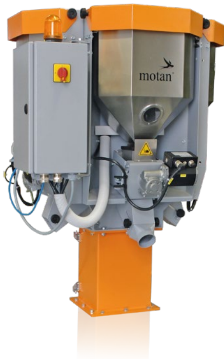
SPECTROCOLOR V tremonha de recolha com capacidade para 10L e três módulos de dosagem