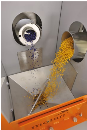
Princípio de mistura por gravidade